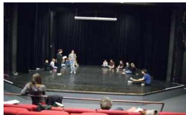
Une séance de travail

L'après option : si le but de l'option n'est pas de former de futurs comédiens, il arrive parfois que les élèves ayant suivi l'option poursuivent cette expérience (faculté arts du spectacle, classes préparatoires à option théâtre, conservatoires etc.). La plupart des élèves en retirent, quel que soit leur choix, une maturité, une autonomie et une culture qui sont une force dans leur vie étudiante.